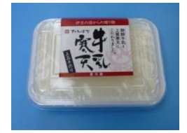
「山ト食品 牛乳寒天」

去る、11月20日から23日の4日間、全国商工会連合会主催、池袋サンシャインシティで開催された「2009にっぽん全国物産展」に山ト食品(株)が出展しました。 新製品の牛乳寒天等各種商品を販売、PRしました。 商工会では、販路開拓のための展示会や商談会への参加を積極的に支援しています。