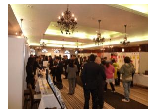
1/25開催の大好評の沼津キャッスル会場

経営革新講演会とパネルディスカッション 13時30分～16時10分 講演会では、「経営革新」に造詣のある講師を招き、経営革新の必要性、効果、経営改善への貢献等について基調講演