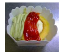
「アルファ食品」 伊豆シフォンロール紅ほっぺスペシャル