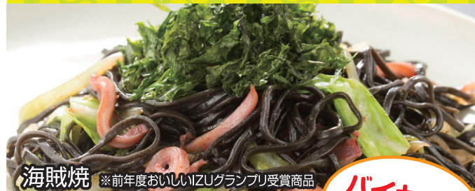
海賊焼 ※前年度おいしいIZUグランプリ受賞商品

みんなで 投票! 第2回 おいしい IZUグランプリ おいしいグランプリを決めよう!