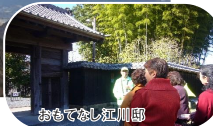
おもてなし江川邸