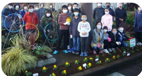
韮山南條本区子ども会と一緒に植え替え作業

月当番で、花壇の整備を頑張って楽しみながらやっています。今年度は新型コロナウイルスの流行で生活が変わってしまったこの世の中。でもみんなでお手入れしているの、花壇のお花はきれいに咲いてくれて、見る人達の心を和ましてくれていると思います。