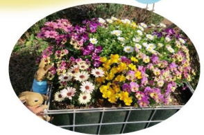
コンクール副賞でラビット購入♪