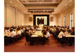
【本年度総会の様子】

韮山反射炉世界文化遺産登録支援/ 東部地域商工行政推進協議会/ 伊豆地区商工会連絡協議会/ 駿豆地区商工振興懇話会/ 狩野川水系水質保全協議会/ 友好都市交流協会への協力/ 東部コンベンションビューロー/ ファルマバレープロジェクト/ 東部地区ランドデザイン策定支援/