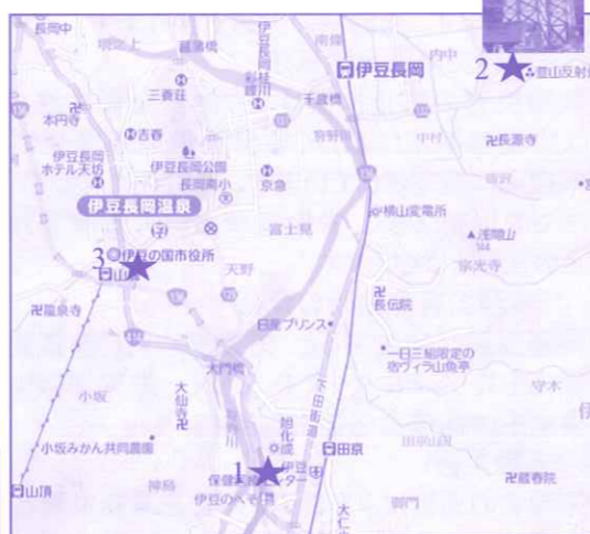
所在地は上記地図をご覧ください。

平成26年に伊豆の国市の地域の特産品などをブランド認定し、市内外へPRを始めた『伊豆の国反射炉ブランド』認定商品は現在52事業所、118品目まで増えています。葦山反射炉の世界文化遺産登録の話題により増加している観光客の方たちへの、PR、販売をしようと販売店も続々と増えております。今回は7月現在伊豆の国反射炉ブランドを購入出来る（近日OPENのショップを含む）事業所をご紹介します。